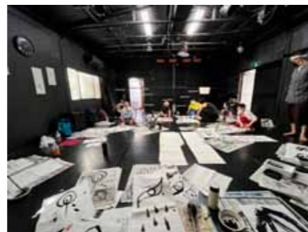
メタモルホールで久しぶりのイベント 8/11「書のワークショップ」開催